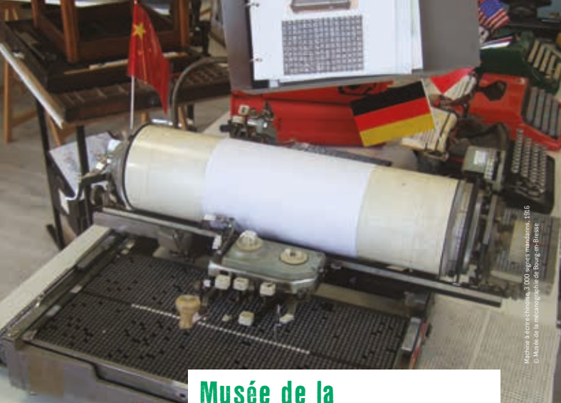
Machines à écrire chinoises, 3 000 signes manuscrits, 1986