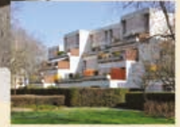
Les immeubles de logement d'une ville en expansion et leurs équipements 1950-1980