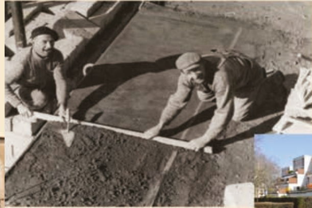
Immeubles remarquables monumentaux équipés